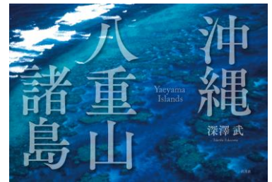
写真集「沖縄・八重山諸島」(青菁社) オールカラー96ページ 定価 2,000円+税